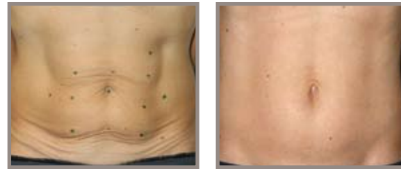
ANTES DE THERMAGE DIEZ MESES DESPUÉS DEL TRATAMIENTO