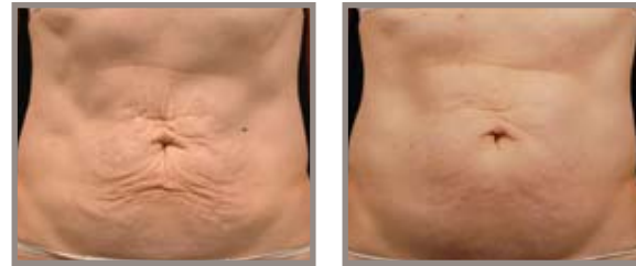
ANTES DE THERMAGE SEIS MESES DESPUÉS DEL TRATAMIENTO

Los signos del envejecimiento pueden empezar a manifestarse en zonas como el vientre, las rodillas, las piernas, los brazos y las manos. Thermage ha desarrollado procedimientos especialmente pensados para ayudar a alisar y tensar la piel arrugada, apergaminada y flácida de estas partes del cuerpo.