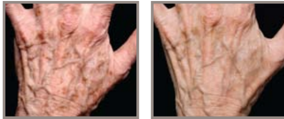
ANTES DE THERMAGE / IPL CUATRO MESES DESPUÉS DEL TRATAMIENTO

Thermage también se puede usar junto con otros tratamientos estéticos. La combinación de IPL y Thermage es una buena fórmula que ayuda a recuperar la firmeza y tersura de las manos y a eliminar las antiestéticas manchas.