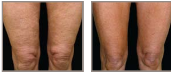
ANTES DE THERMAGE DOCE MESES DESPUÉS DEL TRATAMIENTO